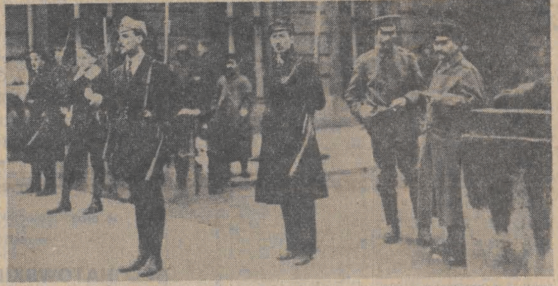
Na zdjęciu: Listopad 1918 r w Warszawie. Akademicy na posterunku przed gmachem Prezydium Rady Ministrów. W głębi rozbrojeni żołnierze niemieccy.