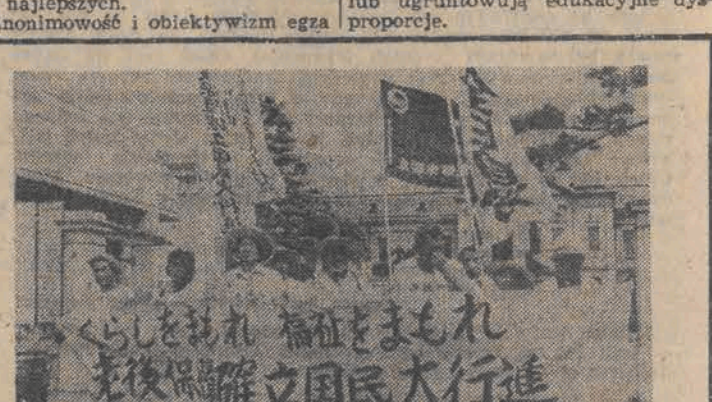
JAPONIA. Demonstracja w Kioto przeciwko planowanemu zniesieniu bezpłatnego leczenia i innych świadczeń dla ludzi starych.