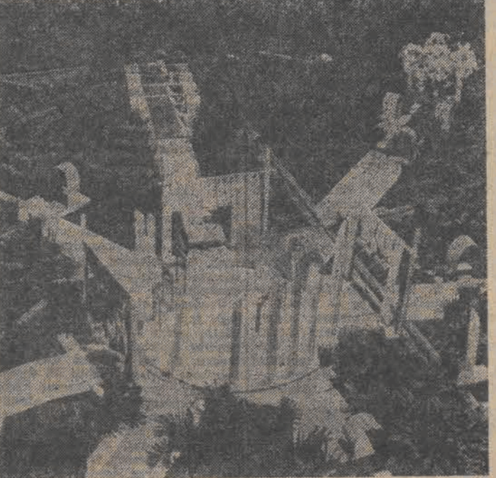
Na zdjęciu: interesujące rozwiązania architektoniczne rejonu Kuskowo.