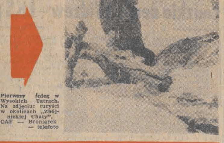
Pierwszy śnieg w Wysokich Tatrach. Na zdjęciu: turyści w okolicach „Złobnickiej Chaty”.