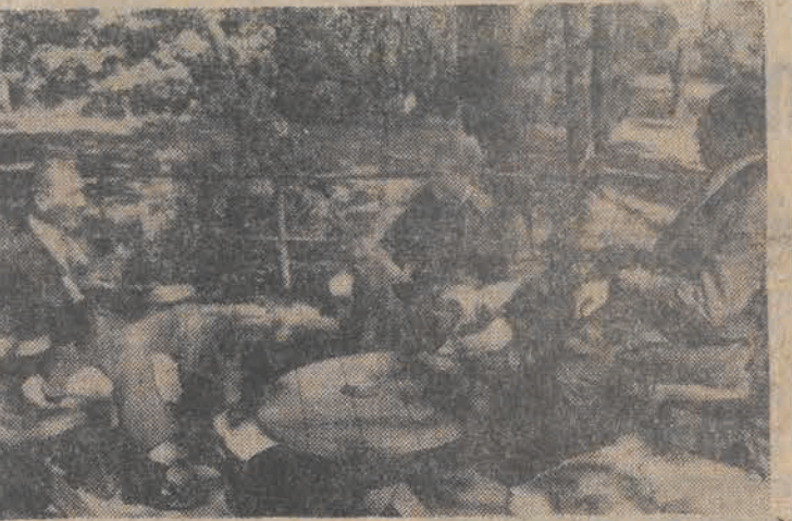
Uczestnicy separatystycznej konferencji w Camp David: od lewej — Sadat, Carter i Begin.

Konferencja Carter — Sadat — Begin, tocząca się w Camp David pod Waszyngtonem, nadal przebiega w warunkach całkowitej blokady informacji. Dziennikarze pracujący w ośrodku prasowym, zorganizowanym w miasteczku Thurmont, w pobliżu letniej rezydencji prezydentów USA, otrzymali jedynie informacje, że w środę dwukrotnie spotkali się Sadat z Beginem i że spotkanie takie odbyło się ponownie w czwartek.