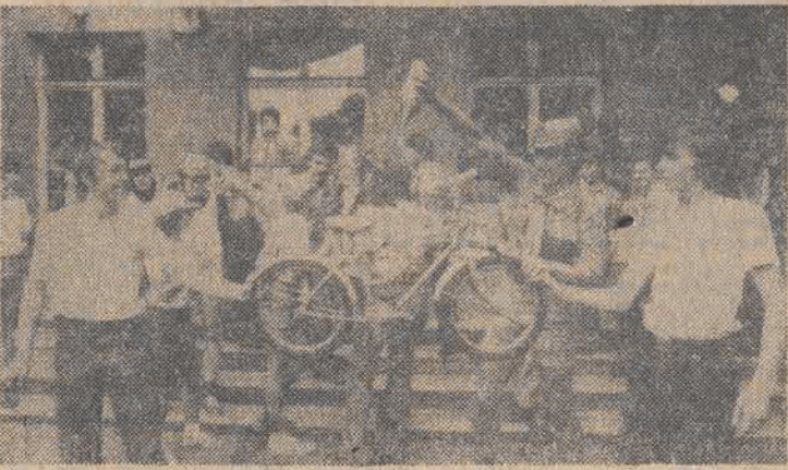
Rekordziści świata w 24-godzinnej jeździe na dziecinnym rowerze „Bobo”, warszawscy harcerze ze szkoły im. Czackiego — w chwili po pobiciu rekordu.