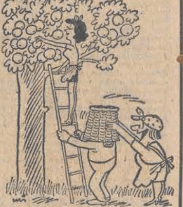
— Teraz będą się panu ręce mnieć, trzęsły przy trzymania drabiny!