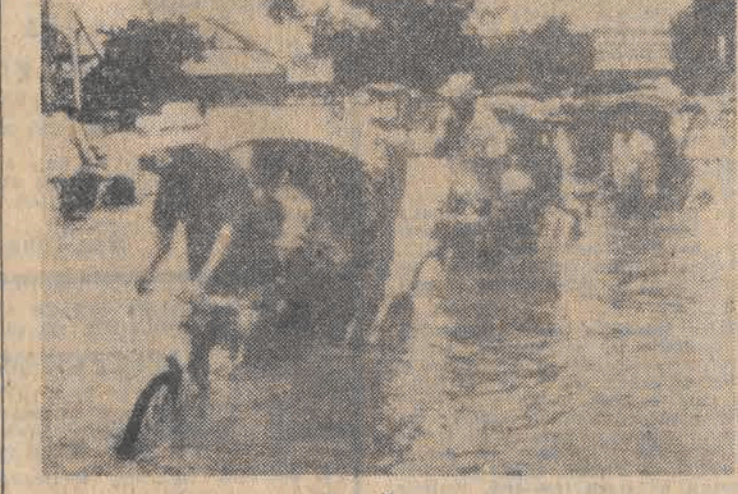
O jednej z największych tragedii podczas obecnej powodzi w Bengalu Zachodnim doniesiono 2 bm. wieczorem z miejsczka Bakshi, 60 km od Kalkuty. Fala wodna wtargnęła tam

3 bm. w drugim dniu XIX Kongresu Międzynarodowego Zrzeszenia Hoteli (AIH) omawiano problemy rozwoju turystyki na świecie, a także współdziałania biur podróży z hotelami. Szczególnie dużo uwagi poświęca się zagadnieniu szkolenia zawodowego kadr hotelarskich oraz randze tego zawodu. Wnioski wynikające z dyskusji posłużą do sprecyzowania zasad i kierunków działalności AIH w ciągu dwóch najbliższych lat, tzn. do następnego kongresu.