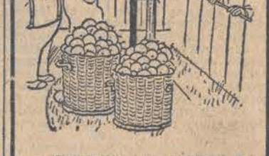
— Oni chyba nie widzieli, jak je kupować na targu!