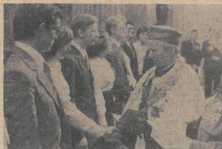
Uroczystość inauguracyjna na Uniwersytecie Łódzkim...