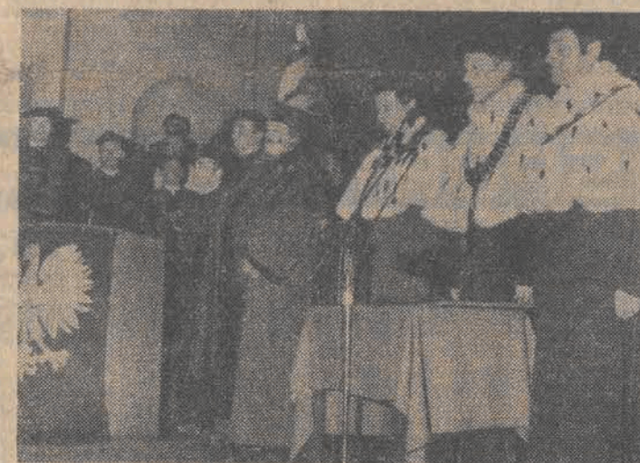
...i w łódzkich uczelniach artystycznych.