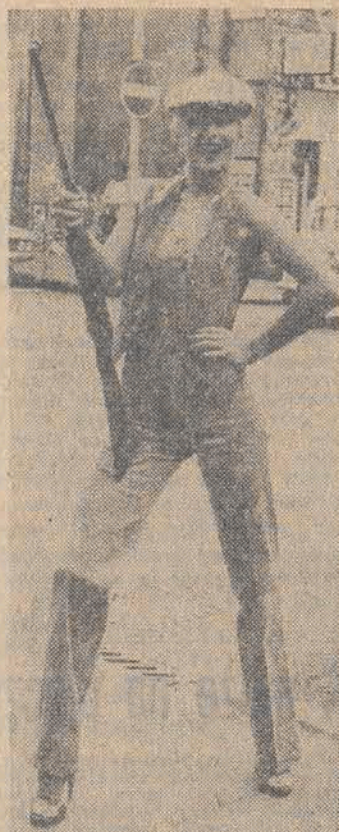
Styl kowbojski z londyńskiej kolekcji mody męskiej.