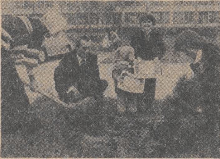
Zaraz po zasadzeniu drzewka dzieci otrzymywały piękne dyplomy „Zielone świadectwo urodzenia”.