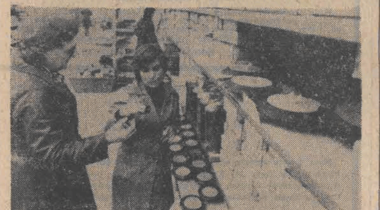
Placówki handlowe uruchomiły na kilkanaście dni przed Świętem Zmarłych kiermasze i dodatkowe stoiska ze zniczami, świecami i lampkami na groby.