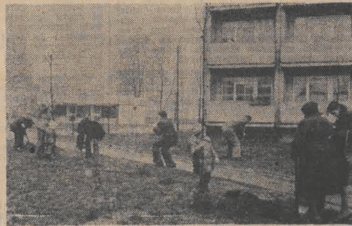
Zielone świadectwa urodzenia na osiedlu Łęczycka - Przedziałnia.