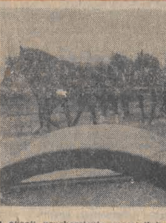
Z okazji uruchomienia nowej linii promowej Swinoujście - Felixtowa (Wielka Brytania), armator - Polska Żegluga Bałtycka i Poczta Polska, zorganizowały przewóz poczty na trasie Kołobrzeg - Swinoujście zabytkowym dylizansem.

Z okazji 60 rocznicy odzyskania przez Polskę niepodległości, minister obrony narodowej gen. armii Wojciech Jaruzelski wydał rozkaz, zgodnie z którym w niedzielę - 5 bm. przeprowadzona zostanie na Placu Zwycięstwa w Warszawie - uroczysta odprawa wart; oddany zostanie także salut 24 salw armatnich.