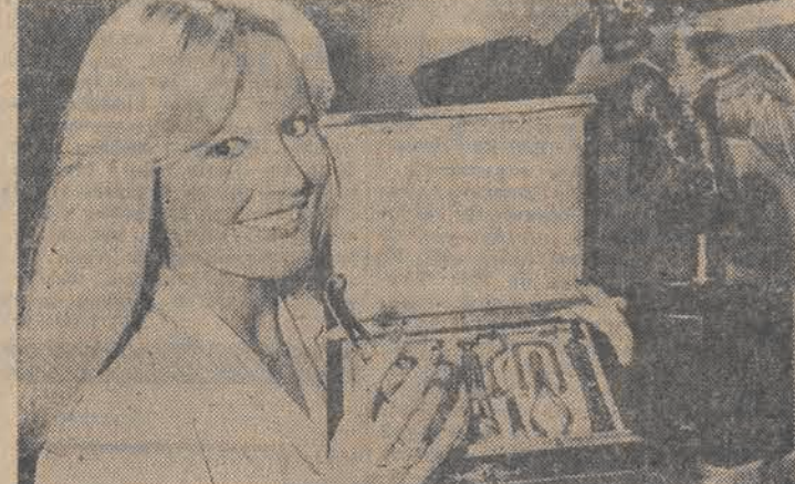
Ten komplet narzędzi dentystycznych z uchwytami z kości lub złota należał do osobistego dentysty samego Napoleona, p. DuBois, który pełnił służbę przy cesarzu przez 7 lat (1806—1813) towarzysząc mu w kampaniach Zaprezentowano je niedawno na Targach Antyków w Paryżu.