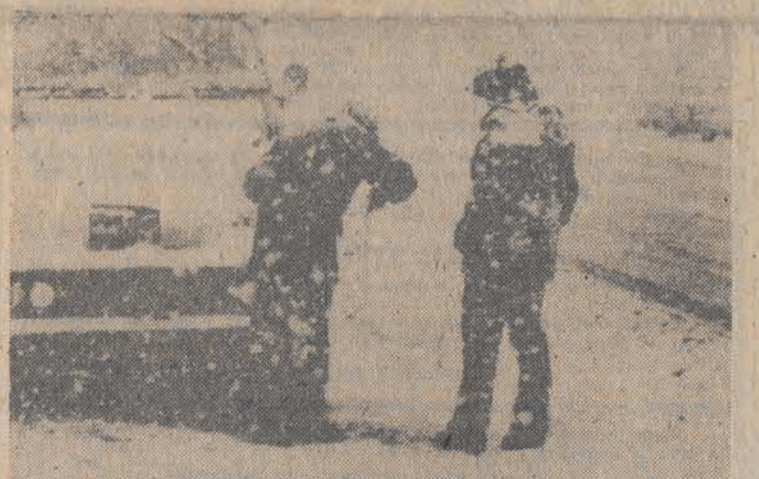
Na skutek obfitych opadów śniegu w Kalifornii, jazda samochodami męczliwa jest przy użyciu łańcuchów.

Burza śnieżna, która wystąpiła w ostatnich 2 dniach, przykrywając połowę terytorium USA śniegiem, pociągnęła za sobą kilkanaście ofiar śmiertelnych.