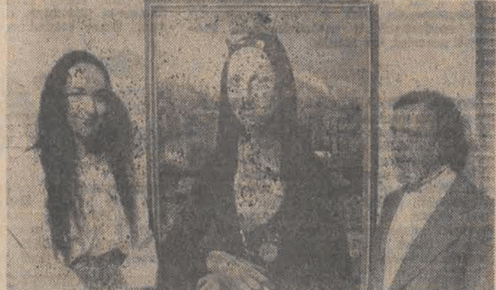
Mona Lisa — najslawniejszy chyba portret na świecie stał się inspiracją do zorganizowania w Duisburgu (RFN) wystawy pt. „Różne oblicza Mony Lisy”. Na tę dość oryginalną ekspozycję złożyło się ponad 100 prac tak znanych artystów jak Salvadoré Dali, Marcel Duchamp, Andy Warhol i wielu innych.