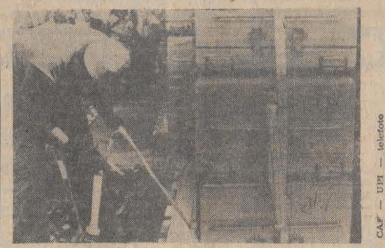
22 km. między Gujaną a amerykańską bazą lotniczą Dover uruchomiono most powietrzny przewożąc zwłoki ofiar tragedii w gujańskiej dżungli. Na zdjęciu trumny ze zwłokami transportowane do samolotu w Georgetown w Gujanie.

wzrosnąć do 800. Dotychczas znaleziono 600 zwłok. W kolejnym komunikacie rzecznik Departamentu Stanu USA poinformował, że liczba znalezionych zwłok członków sekty „Świątynia Ludu” wzrosła do 775. Nie jest to jeszcze ostateczny bilans ofiar tragedii.