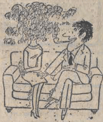
— A od czego to, kochanie, powinienem się odzwyczczać?