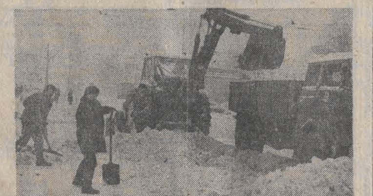
Obciążliwe opady śniegu zmuszają służby komunalne do zwiększonego wysiłku przy jego uprzątnięciu. Uruchomiono ciężki sprzęt, a w pracy pomagają żołnierze, studenci, załogi łódzkich zakładów pracy.