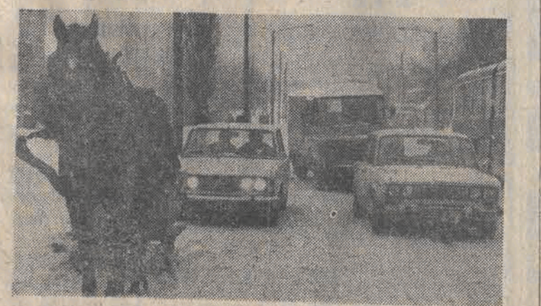
Najpewniejszym środkiem lokomocji stały się teraz... sanie. Coraz więcej widzimy ich na łódzkich ulicach. Za sprawą surowej zimy spódniewać się należy powrotu do dawnych, tradycyjnych środków lokomocji.