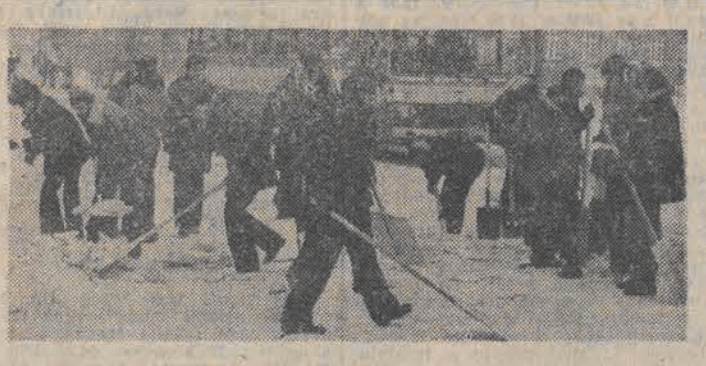
Do akcji odśnieżania aktywnie włączyli się również łódzcy studenci. Wczoraj zgłosiło się do pracy około 1000 studentów i pracowników PZ, którzy odśnieżali teren uczelni, osiedla akademickie i pobliskie skrzyżowania. Najliczniej reprezentowany był Wydział Mechaniczny. Na Uniwersytecie Łódzkim na apel Rady Miast i władz uczelni stawilo się 800 studentów i 120 pracowników dydaktyczno-nauczycielskich. Dziś studenci PZ usuną śnieg z ulic i placów Polesia, zaś studenci UL — z ulic Śródmieścia.