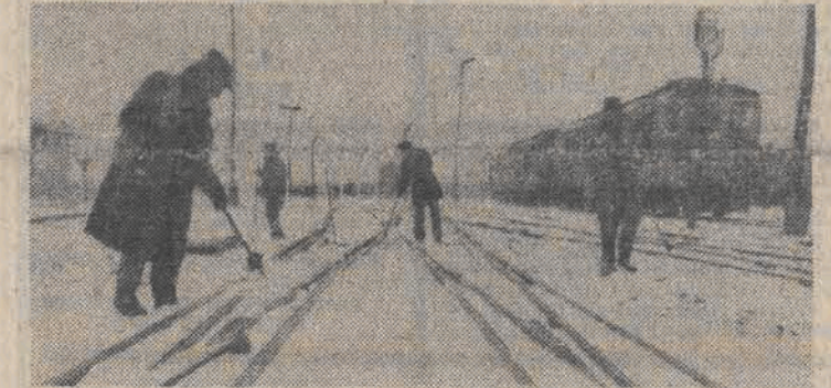
Obfite opady śniegu nawiedziły w ostatnich dniach niektóre rejon kraju. Utrudniają one znacznie pracę kolejarzy.

Zakłócenia w komunikacji Szybko usuwać śnieg z dachów!