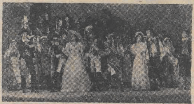
14 i 15 bm. odbędą się w Łódzkiej Teatrze Muzycznym dwa ostatnie przedstawienia operetki Karola Millockera „Gasparone”...