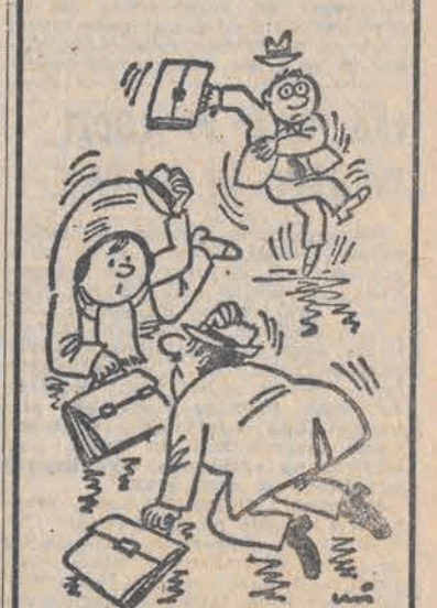
— Pan dyrektor również cierpi na goliolę?