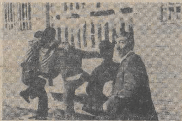
Na zdjęciu: zwolennicy Chomeiniego forsują wejście do więzienia Evin, w którym przebywają więźniowie polityczni.

Irańska rewolucja antymonarchiczna zatriumfowała ostatecznie w poniedziałek po trwających ponad dwie doby walkach, które pochłonęły co najmniej 500 ofiar. Tego dnia premier tymczasowego rządu islamskiego, Mehdi Bazargan rozpoczął około południa urzędowanie w gmachu Prezydium Rady Ministrów. Jednocześnie nowe władze przejęły siedzibę cesarza w Teheranie — Pałac Niawaran, którego straż jako ostatnia w stolicy złożyła broń. Sporadyczne walki w niektórych punktach stolicy trwały jeszcze w poniedziałek rano. Nieznany jest los byłego premiera Bachtijara — przedstawiciele nowych władz przypuszczają, że wbrew krążącym pogłoskom o jego samobójstwie, znajduje się on w uwięzieniu.