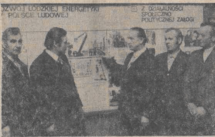
Z WIZYTY EDWARD GIERKA W CZECHOSŁOWACI (POLSCE LUDOWEJ) Z DZIAŁALNOŚCI SPOŁECZNO-POLITYCZNEJ ZAŁOŻY