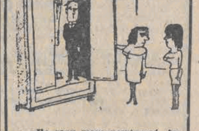
— Ile razy mam powtarzać, żebyś nie wkładała swoich rzeczy do mojej szafy?!