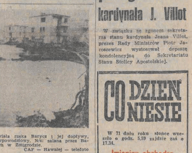
W województwie wrocławskim wyłaził rzeka Barycz i jej dopływy, a na Odrze ogłoszono alarm przeciwpowodziowy. Niz: zalana przez Barycz budowa domów jednorodzinnych w Zmigrodzie.