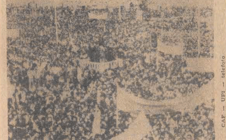
W wielu krajach nadal trwają protesty przeciwko separatystycznemu układowi izraelsko-egipskiemu...