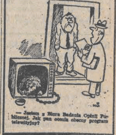
— Jesteś z Miura Radziszka Opinię Póliem. Jak pan ocenia obecny program telewizyjny?