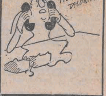
KOLEGO, POTRZEBA MI TYLKO JEDEN TELEFONIK...

Słońce jest swego rodzaju natchnieniem, dlatego zawsze powinno nam świecić.