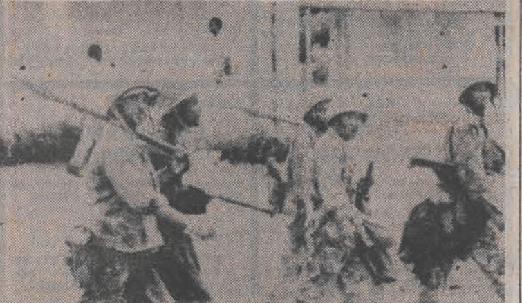
Wojska tanzańskie opuszczają stolicę Ugandy, Kampalę, udając się w rejonny kraju, zajęte jeszcze przez wojska Idi Amina.

Wyzwolenie oddziały ugandyjskie oraz armia tanzańska zajęły w niedzielę rano przemysłowe miasto Dżindża, broniona przez około 1000 żołnierzy wiernych jeszcze prezydentowi Aminowi. Opor był jednak słaby i po kilku godzinach walk zwolennicy Idi Amina oraz prawdopodobnie sam Amin uciekli z miasta w kierunku granicy z Kenią. Dżindża jest