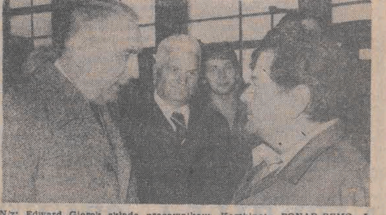
N/z: Edward Gierka składa pracownikom Kombinatu PONAR-REMO J. Bierzyńskiego, serdeczne życzenia - okazji 1 Maja.

PRZED ZBLIŻAJĄCYM SIĘ DOROCZNYM ŚWIĘTEM LUDZI PRACY I SEKRETARZ KC PZPR EDWARD GIEREK ODWIEDZIŁ 28 BM. KILKA WARSZAWSKICH ZAŁÓG BUDOWLANYCH I PRZEMYSŁOWYCH.