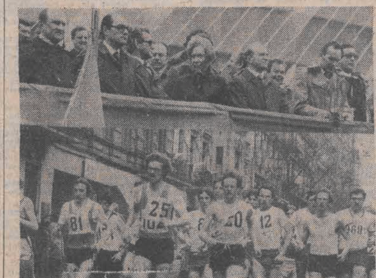
N/z: u góry — trybuna honorowa, u dołu — juniorzy na trasie.