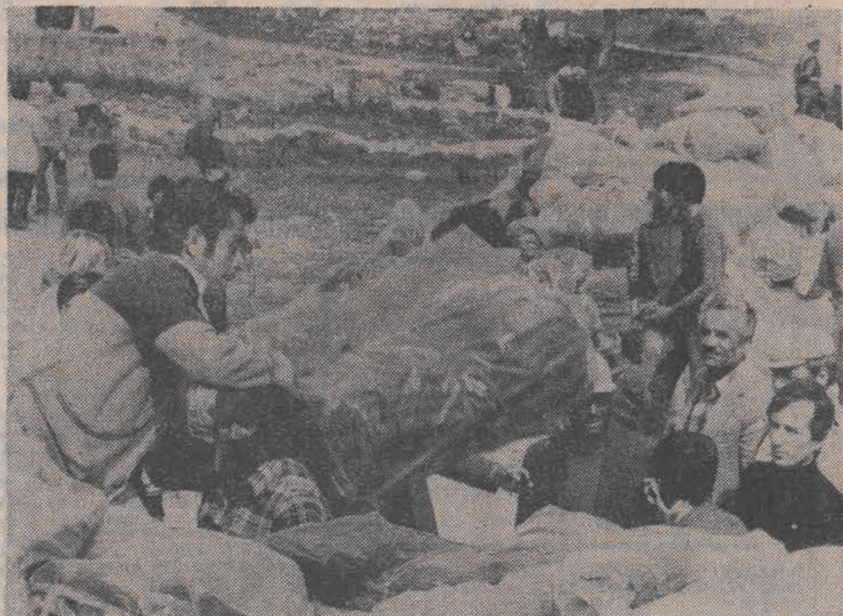
Do portowego miasta Bar, zniszczonego przez trzęsienie ziemi z trudem dojeżdżają ciężarówki z namolatami koczami i żywnością.