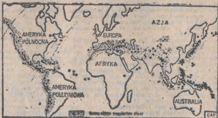
Mapa Terym objęta trzęsieniem ziemi w latach 1976-78.