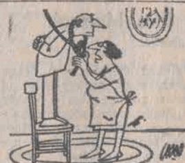
— Do ostatniej chwili nie pomyślaj niczego samemu zrobić...