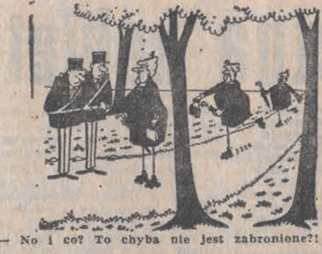
— No i co? To chyba nie jest zabronione?

■ MIESZKAŃCY PRUSKOWA bardzo narzekali na masarnie przy ul. Daszyńskiego, która wędziła nie tylko przetworzone mięso, lecz przy okazji całą okolicę. Uchwalili dla otoczenia zakład przeniesienia do Komorowa i przez jakiś czas atmosfera była czysta. Wkrótce jednak w tym samym miejscu znowu otworzy masarnie, która podobnie jak poprzednia zatrzymała w powietrzu, tyle że przedmiotem była to masarnia uspołeczniona, a teraz jest mu: — Same dziwactwa wywożesz wpuścić, bo lech to żadna różnica, bo przyła w połowie była pusta. Watny swąd jest również dokuczliwy. ■ W MIESIECU CHIBA w