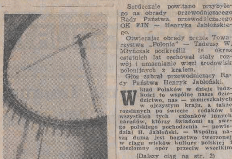
11 firm specjalistycznych pracuje przy budowie elektrowni „Opole”. Obecnie główne prace koncentrują się przy wznoszeniu kotłowni, chłodni oraz budynku głównego. Pierwszy etap z „Opola” powinien pójść w 1981 roku. Na zdjęciu: montaż pierwszych konstrukcji na I bloku.

25 bm. odbył się w Warszawie V Zjazd Towarzystwa „Polonia”. W zjeździe wzięło udział 500-osobowe grono działaczy towarzystwa i współpracujących z nimi instytucji, organizacji społecznych, środowisk twórczych, stowarzyszeń regionalnych, związków wyznaniowych.