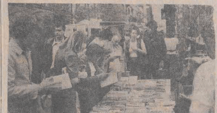
Na zdjęciu: jarmarkowy bukinista.