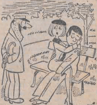
— Usnął, co?