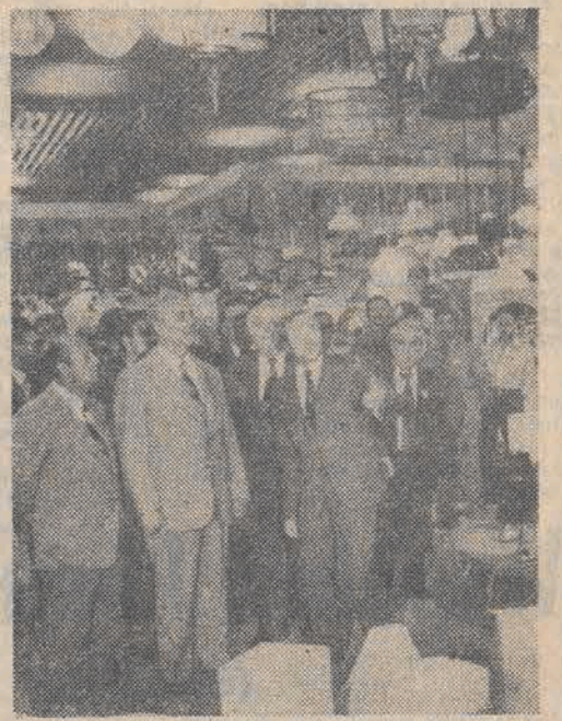
Na zdjęciu: Edward Gierek w pawilonie Polamu.

Podczas targowej wizyty towarzyszyli mu: zastępca członka Biura Politycznego KC PZPR, wicepremier, przewodniczący Komisji Planowania przy Radzie Ministrów Tadeusz Wrzaszczyk, członek Sekretariatu KC, kierownik Wydziału Przemysłu Lekkiego, Han-