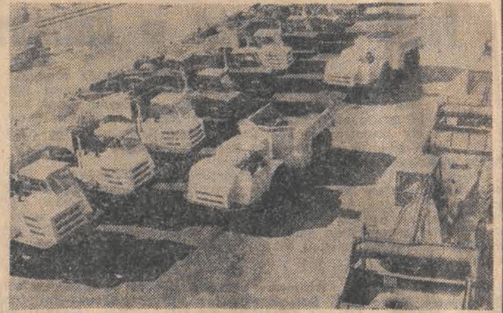
ZSRR: Na wielu budowach w całym Kraju Rad pracują ciężarówki o nazwie MoAZ z zakładów samochodowych w Mohylewie (Białoruska SRR). Ostatnio w fabryce przyszyła produkcja 20-tonowych wywrotek, a w przygotowaniu jest model 22-tonowy. Wywrotki z Mohylewa są eksportowane do 15 krajów.