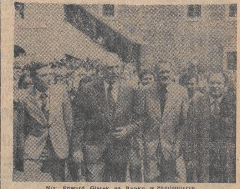
N/z: Edward Gierek na Rynku w Sandomierzu.

1 SEKRETARZ KC PZPR, EDWARD GIEREK, PRZEBYWAŁ 30 CZERWCA W WOJ. TARNOBRZESKIM, JEDNYM Z WAŻNIEJSZYCH REGIONÓW PRZEMYSŁOWYCH KRAJU, W KTÓRYM DOMINUJĄCĄ ROLĘ ODGRYWA WYDOBYCIE I PRZETWÓRSTWO SIARKI.