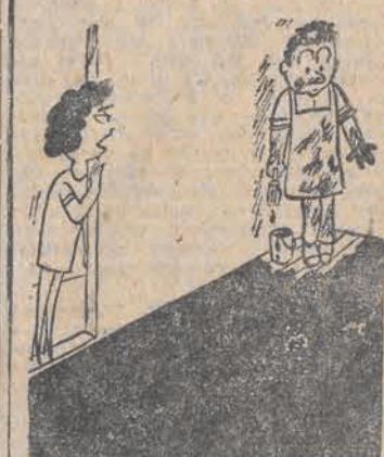
— Spółdzielnia pracy lepiej by sobie poradziła z malowaniem!