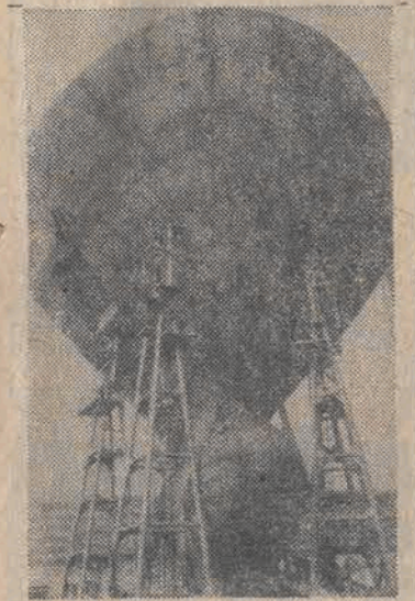
W Stoczni Im. Komuny Paryskiej w Gdyni budowany jest statek RO-RO dla armatora norweskiego, o nośności 22 tys. ton. N/z: przeniesienie bloku dziobowego dźwignica bramowa.

Przewodniczący grupy parlamentarnej ZSRR, przewodniczący Rady Związku — jednej z izb Rady Najwyższej ZSRR, Aleksiej Szytikow spotkał się we wtorek z przywódcą większości demokratycznej w Senacie USA Robertem Byrdem który przebywa w Moskwie jako gość grupy parlamentarnej ZSRR. Omówiono zagadnienia dotyczące stosunków radziecko-amerykańskich a także niektóre problemy międzynarodowe. Podkreślono szczególne znaczenie radziecko-amerykańskiego spotkania na szczycie w Wiedniu i podpisania układu SALT-II dla zapewnienia pokoju i bezpieczeństwa narodów.