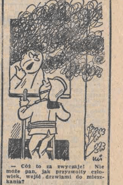
— Cóż to za zwycaje! Nie może pan, jak przywołuje człowieka, wejść drzwiami do mieszkania?