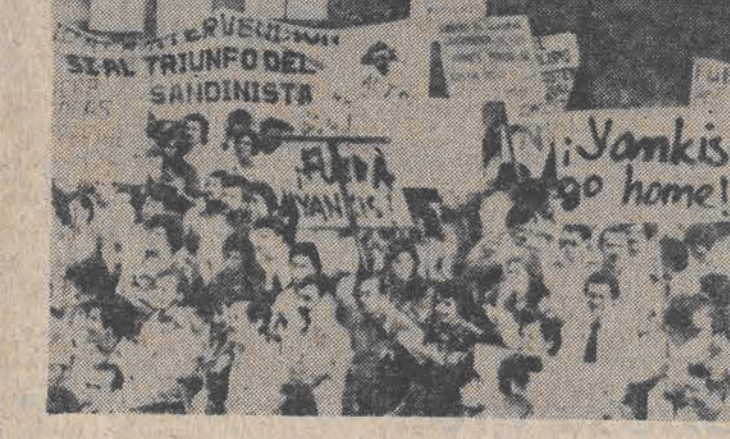
W mieście Liberia w Kostaryce odbyła się 1 bm. demonstracja ludności, potępiającej zbrodnie gardzistów dyktatora Somozy w Nikaragui.