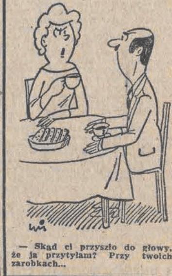
— Skąd ci przyszło do głowy, że ja przyszyłam? Przy twoich zarobkach...