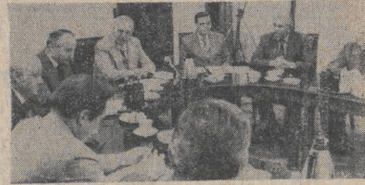
N/Z: podczas spotkania.