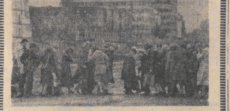
Dokładnie rok temu na skrzyżowaniu ul. Piotrkowskiej z ul. Mickiewicza, przechodnie z wielkim trudem przedstawiali się przez plac budowy...