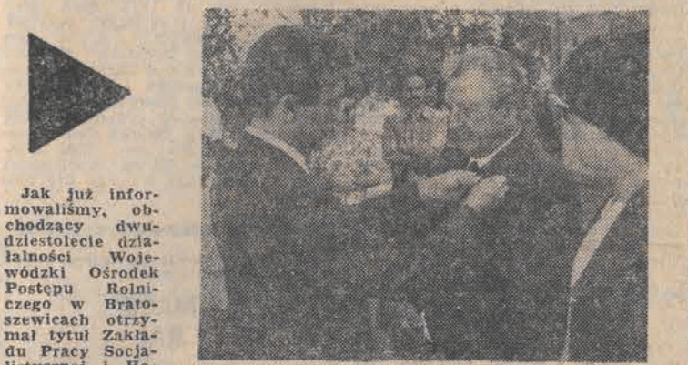
Jak już informowaliśmy, obchodzący dwudziestolecie działalności Wojewódzkiego Ośrodka Postępu Rolniczego w Bratoszewicach...