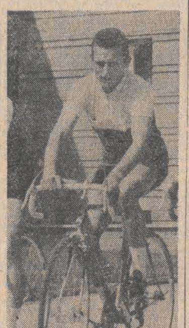
pouczła dzentelmeństwa u rywala, o wypaczeniu sensu szosowej rywalizacji...