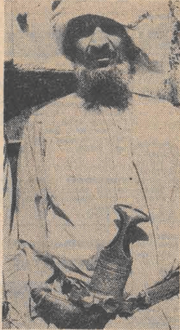
Mieszkaniec Omanu w tradycyjnym stroju.