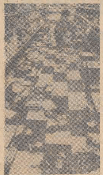
6 bm. trzęsienie ziemi nawiedziło środkową Kalifornię. Na skutek wstrząsów zarysowało się kilka budynków. Ofiar w ludziach nie było. N/z: na skutek trzęsienia ziemi w supermarkcie w miejscowości Salinas pospadły towary z półek

plecia, doprowadzić do destabilizacji ekonomicznej i politycznej w Demokratycznej Republice Afganistanu — disse radzieckie czasopismo „Międzynarodowa Żywa” w artykule na temat wydarzeń w Afganistanie. (Dalszy ciąg na str. 2)