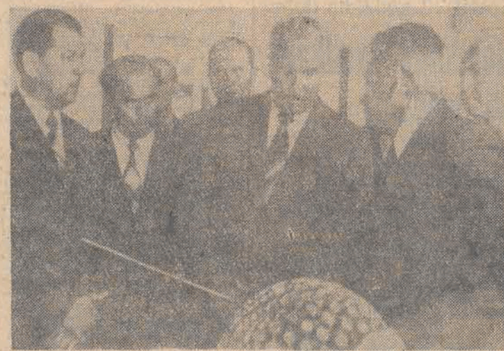
N/z: podczas spotkania w Kijowskim Instytucie Spawalnictwa Elektrycznego im. prof. Patona.

brojenia i zahamowania wyścigu zbrojeń oraz bezpieczeństwa i współpracy w Europie.