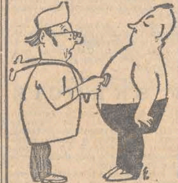
— Niech się pan przyniży — a objawów sklerozy pan u siebie nie spostrzeżę?

Taka sobie myśl Nieczego się nie wie od razu; to co w naszym przekonaniu wiemy od razu, poznaliśmy dawno temu. Uśmiechnij się