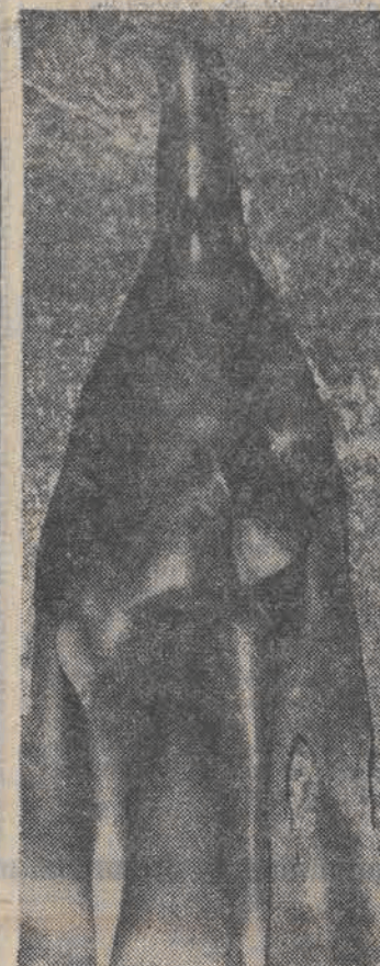
N/z: tak prezentują się obecnie rzeźby w kaplicy św. Antoniego.