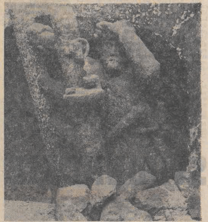
N/z: Jedną z lepiej zachowanych rzeźb z kopalni w Wieliczce.

Kopalnie soli w Wieliczce znają przynajmniej ze słyszenia wszyscy Polacy. Mało kto jednak wie, że 700-letniemu zabytkowi grozi zagłada. Nie o sól tu chodzi. Jej złoża nie są bowiem wielkie — będą eksploatowane jeszcze najwyżej przez 10 lat. Najistotniejsze jest niebezpieczeństwo, grożące zabytkowym komorom, korytarzom i najcenniejszym obiektowi kopalni, wykutej w ścianie soli, wspaniałej kaplicy św. Antoniego, której cenę rzeźby rozpylają się. Do miszerni cennego zabytku przyczynili się także zwiędnięte kaplice w Wieliczce. Ich oddech (kaplica jest niewielkim pomieszczeniem a Wieliczka zwiędła rocznie kilkaset tysięcy ludzi), przyspieszyły i pogłębiły proces niszczenia rzeźb. Nie więc dziwnego, że konserwatorzy zastanawiają się nad przyszłym udolepieniem kaplicy dla zwiędających — prawdopodobnie będzie można ją oglądać bez wchodzenia do środka.