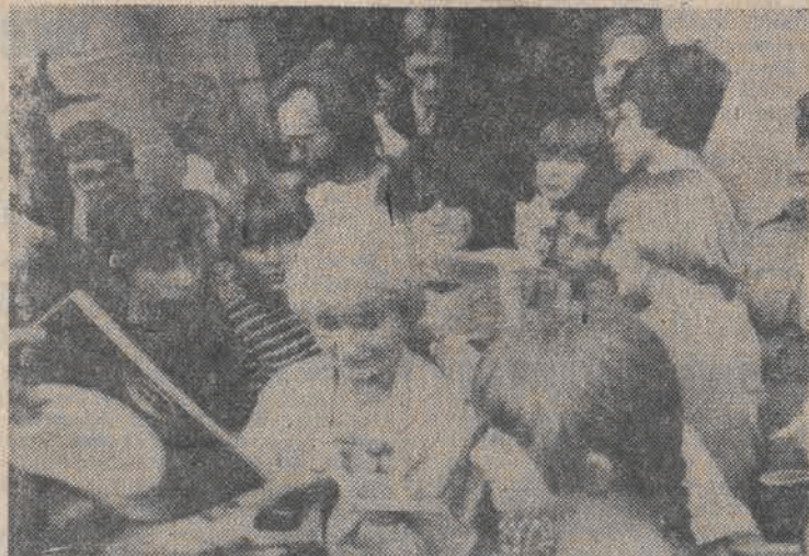
Piosenkarka z Finlandii - Ritwa Oksanen rozdaje autografy przed Grand Hotelem w Sopocie.