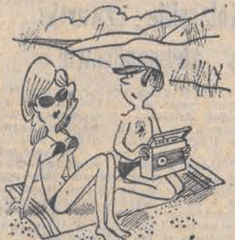
— Cały urlop na nic — baterie wysiadły!..