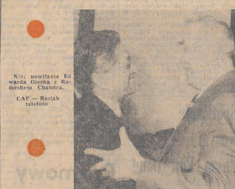
N/z: powitanie Edwarda Gierka z Romeshem Chandrą.

30 BM. I SEKRETARZ KC PZPR, EDWARD GIEREK, PRZYJĄŁ PRZEBYWAJĄCEGO W POLSCE PRZEWODNICZĄCEGO ŚWIATOWEJ RADY POKOJU, ROMESHA CHANDRE.