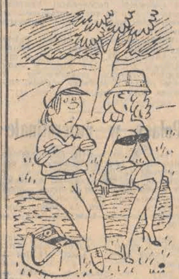
— Kazik, włącz radio, ta cisza jest nie do zniesienia!