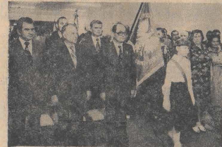
Moment wkrócenia pocztów sztandarowych na uroczystość inauguracji nowego roku szkolnego w województwie łódzkim.

nowy rok nauki. Dla nauczycieli jest to kolejny etap przeobrażenia systemu edukacji — programem nauczania szkoły 10-letniej objętych jest już milion dzieci klas I i II.