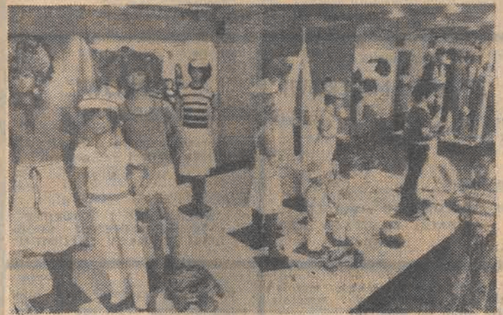
Targi Krajowe Jesień 1979. Fragment kolekcji odzieży dziecięcej.