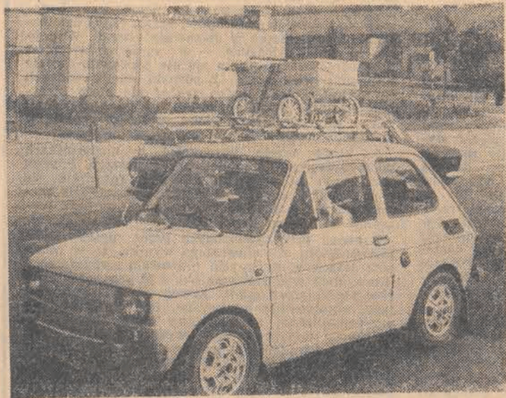
Konieczność zmusza i do takich rozwiązań.