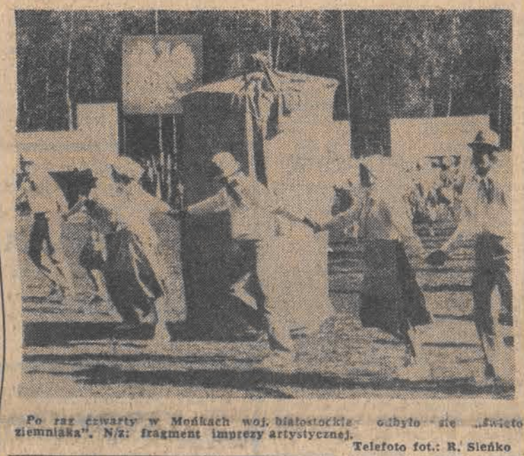
Po raz czwarty w Modkach woj. bielskiej odbyło się „Święto ziemniaka”. N/z: fragment imprezy artystycznej.