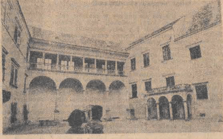
Zamkowy dziedzińiec.

Położony na zachód od Brna, na Wyżynie Czesko-Morawskiej Teif, to miasteczko — muzeum. Turystów przyciąga tu piękny renesansowy zamek i w jego bezpośrednim sąsiedztwie — imponujących rozmiarów rynek.