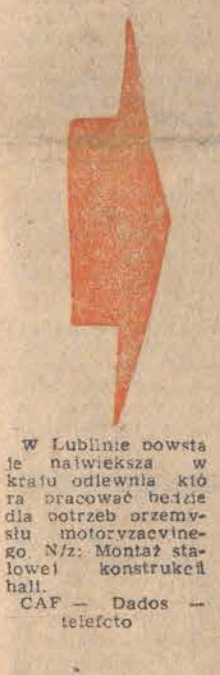
W Lublinie powstała największa w kraju odlewnia która pracować będzie dla potrzeb przemysłu motoryzacyjnego. N/Z: Montaż stalowej konstrukcji hali.

H. Jabłoński złoży wizytę w Meksyku i Kostaryce Na zaproszenie prezydenta Meksyku Jose Lopez Portillo i prezydenta Kostaryki Rodrigo Carazo Ochoa uda się w najbliższych dniach z wizytą oficjalną do Meksyku i Kostaryki przewodniczący Rady Państwa PRL Henryk Jabłoński.