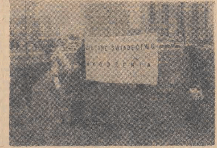
Na Retkini akcja przebiegała bardzo sprawnie, a frekwencja przeszyła oczekiwania organizatorów...