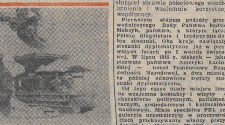
Machowice oraz obiektami przemysłowymi osłonięty już w 1970 r. 4 miliardy złotych wartości produkcji. Niz: kopalnia siarki „Jezioro” — przy zakładunku siarki na taśmociąg.

Będzie to pierwsza polska wizyta na tym szczeblu w krajach kontynentu Ameryki Łacińskiej. Stawia ona podkreślenie wagi, jaką przywiązuje Polska do współpracy z państwami tego regionu świata, służącej sprawie pokojowego współistnienia i wzajemnie korzystnej współpracy.