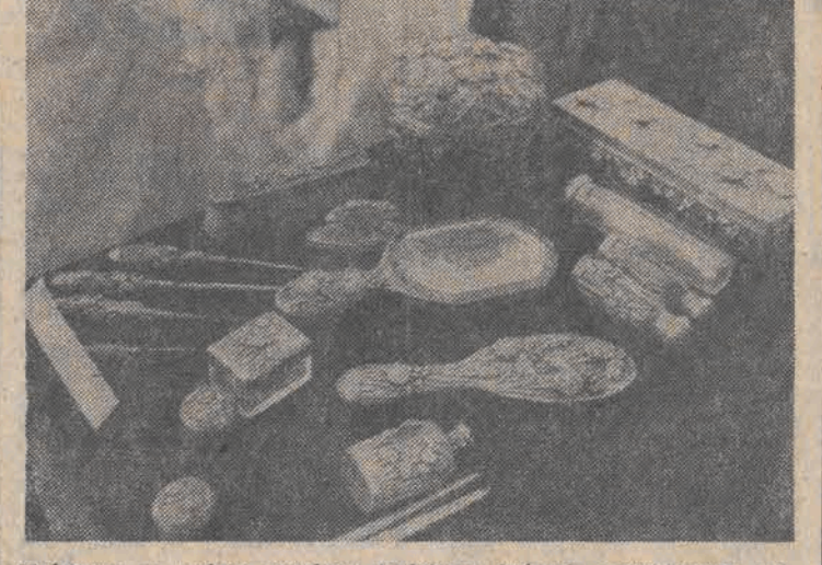
Wykonane w srebrze przybory toaletowe, których przeznaczenia możemy się już tylko domyślać...