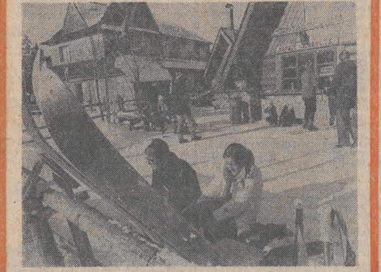
Przygotowania do zjazdu.