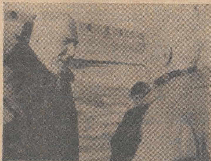
N/z.: powitanie na lotnisku w Pradze.