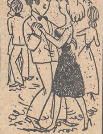
- Przez cały taniec powiedział, że pani tylko jedno słowo: „Au”!