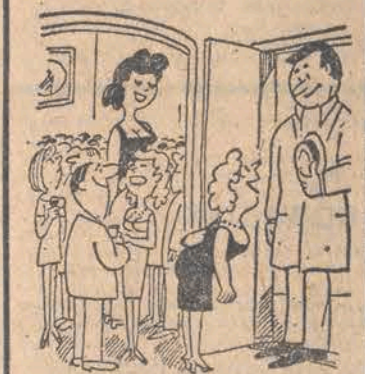
— Ach, jak to dobrze, że pan przyszedł!...