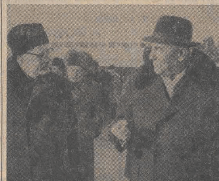
Nr. Edward Gierek podczas rozmowy z Michaiłem Susłowem.

Stan zdrowia prezydenta Jugosławii Josipa Broza Tito uległ pogorszeniu. W niedzielę w południe ogłoszono w Belgradzie komunikat medyczny stwierdzający, że rekonwalescencja prezydenta po dokonanej przed trzema tygodniami amputacji lewej nogi przebiega w ostatnich dniach wolniej, ponieważ chory cierpi na zaburzenia w działalności przewodu pokarmowego i nerek.