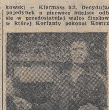
we 5:3, a w ostatniej Makówka wygrał z Kiermaszem 5:1.