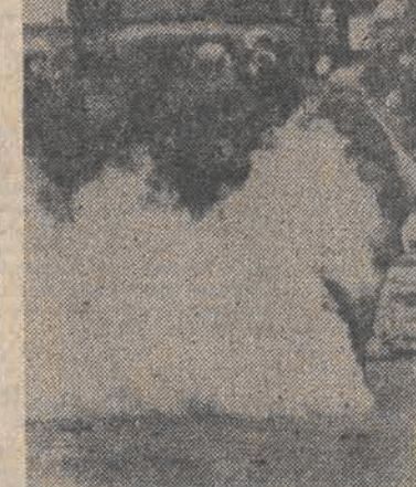
W Fourons w pobliżu Lige w Belgii doszło do starć między ludnością walońską a flamandzką. Niz: policja belgijska interweniuje podczas starć między Walonami i Flamandami.

Prezydent Republiki Zimbabwe zostanie wybrany na wspólnym posiedzeniu obu izb parlamentu.