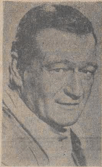
W niedzielę, 23 marca, w Filmotece Arcydziel „Dyliżans” - amerykański western w reżyserii Johna Forda z Johnem Wayne w roli głównej.