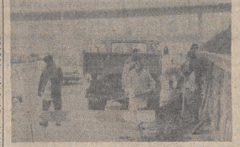
Nadeszła wiosna. Porządki na Trasie Łazienkowskiej w Warszawie.