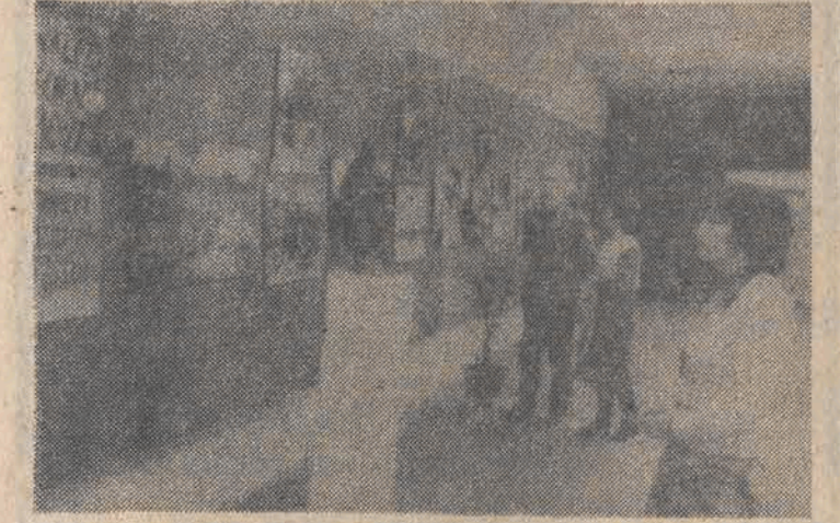
W czeskosłowackim mieście Terezín otwarta została wystawa „Polska w walce o wolność”, na której przedstawione zostały dokumenty z okresu II wojny światowej.